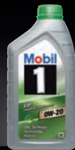
Mobil 1™ ESP x2 0W-20