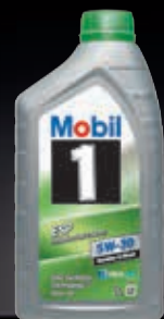
Mobil 1™ ESP 5W-30