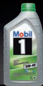
Mobil 1™ ESP x3 0W-40