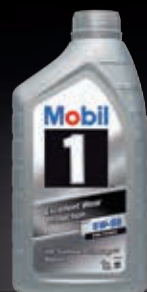
Mobil 1™ FS x1 5W-50