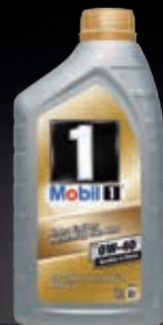
Mobil 1™ FS 0W-40