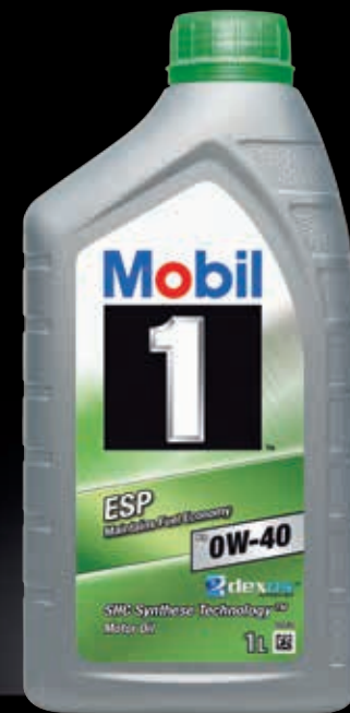
Mobil 1™ ESP x3 0W-40 Der erste Schmierstoff mit Porsche C40 Freigabe!